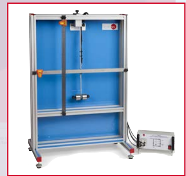
MEVLB Equipo de Estudio de Vibración Libre en Barras