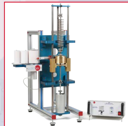
MVL Equipo de Vibraciones Libres