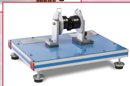
MAC Mecanismo de Acoplamiento