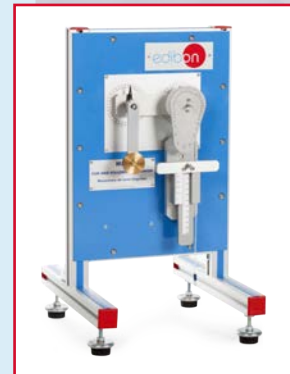
MEX Mecanismo de Leva - Seguidor