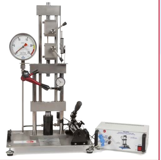
EEU/20KN Equipo de Ensayo de Materiales Universal