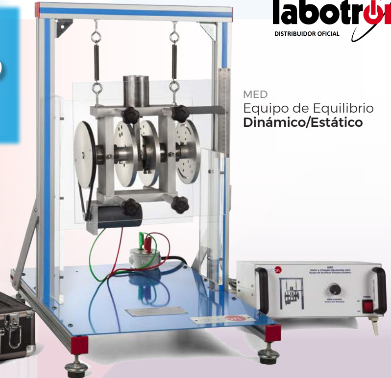
MED Equipo de Equilibrio Dinámico/Estático