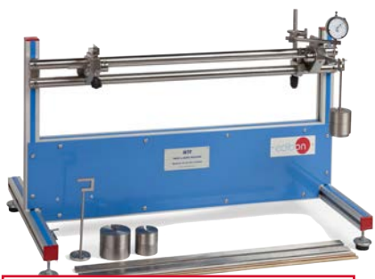
MTP Equipo de Torsión y Flexión