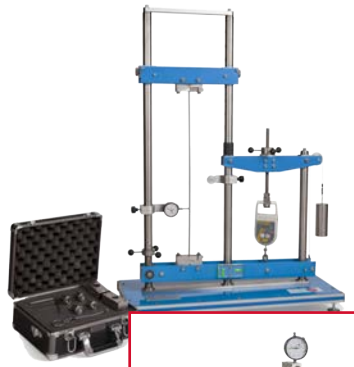
MUP Equipo Universal de Pandeo