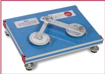
MCA Mecanismo de Cuatro Barras