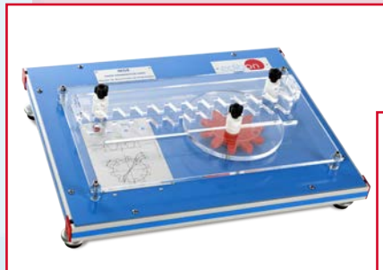
MGE Equipo de Generación de Engranajes