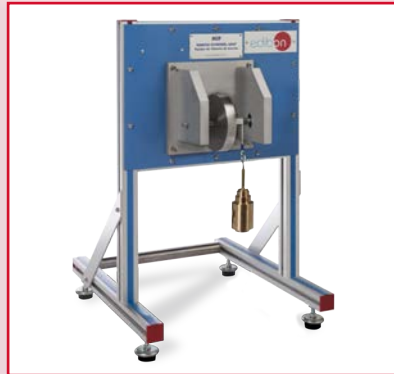
MIF Equipo de Volante de Inercia