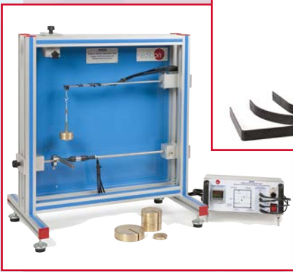
MEGE Equipo de Entrenamiento de Galgas Extensométricas